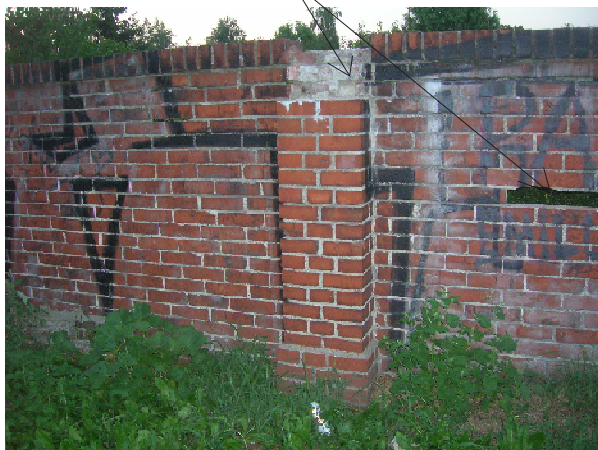
widok na ścianę