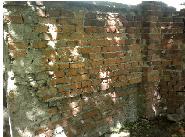
fragment muru do wyburzenia i wymurowania na nowo